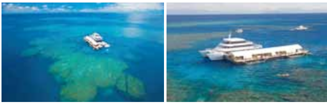
グレートバリアリーフ(モアリーフ) クルーズ船と観測予定地